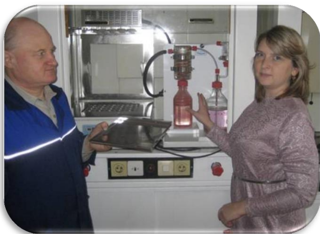
Блок сжигания – I этап анализа на содержание в зерне белка Н.Б. Помазкин, О.А. Юсова